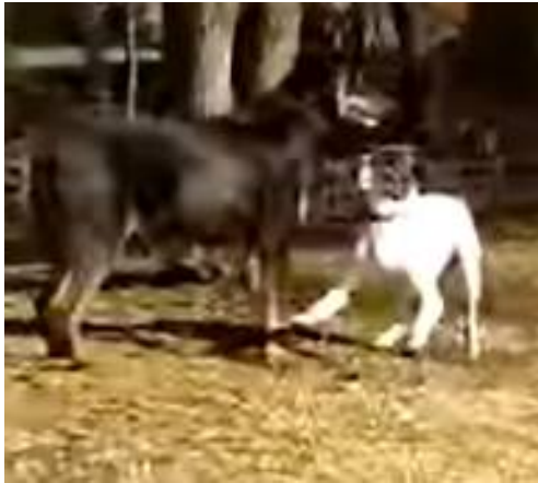
Appel au jeu