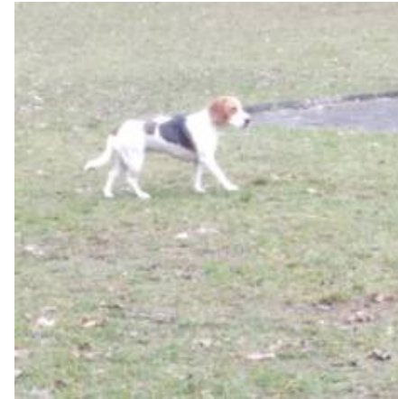
Approcher en courbe/approcher lentement