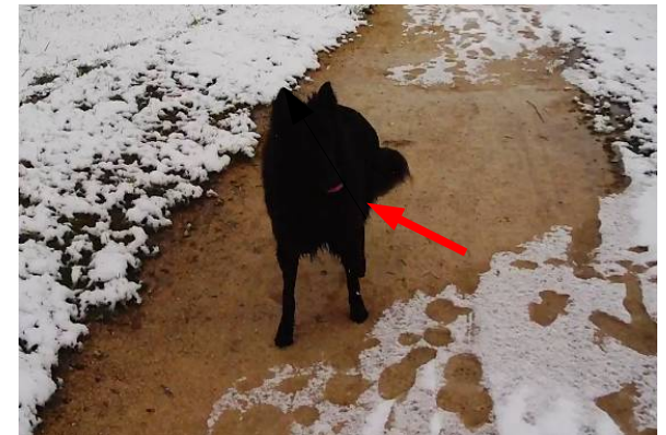
Sortir la langue