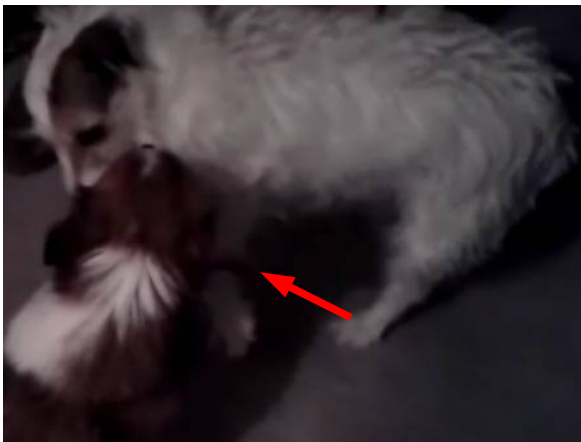
Lever la patte