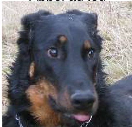
Détourner les yeux