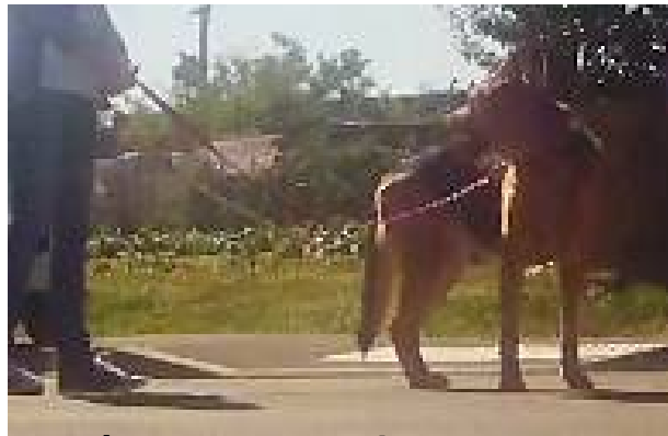
Détourner la tête/le corps